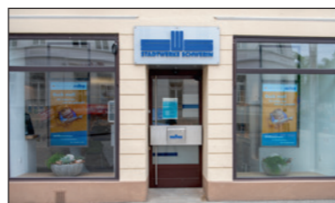
Kundencenter ist wieder geöffnet.

ihre Bewerbungen einreichen. Eine konkrete Bewerbungsfrist gibt es dabei nicht. Trotzdem sollten die jungen Leute nicht zu lange warten, denn der Prozess der Vorauswahl beginnt bereits im Oktober. Zu dem Verfahren gehören ein schriftlicher und mündlicher Eignungstest sowie ein persönliches Vorstellungsgespräch. Beide Komponenten bilden die Vorstufe zur finalen Auswahl. Bei den Bewerbungsunterlagen sollten neben dem Bewerbungsschreiben und dem Lebenslauf die letzten zwei Zeugnisse sowie Praktikumsnachweise auf keinen Fall fehlen. Die Ausbildung bei den Stadtwerken bietet einen soliden Start in die berufliche Zukunft. Mehr Informationen gibt es auf der Webseite unter www.stadtwerke-schwerin.de - „Karriere & Ausbildung“. Ute Becker-Frenzel