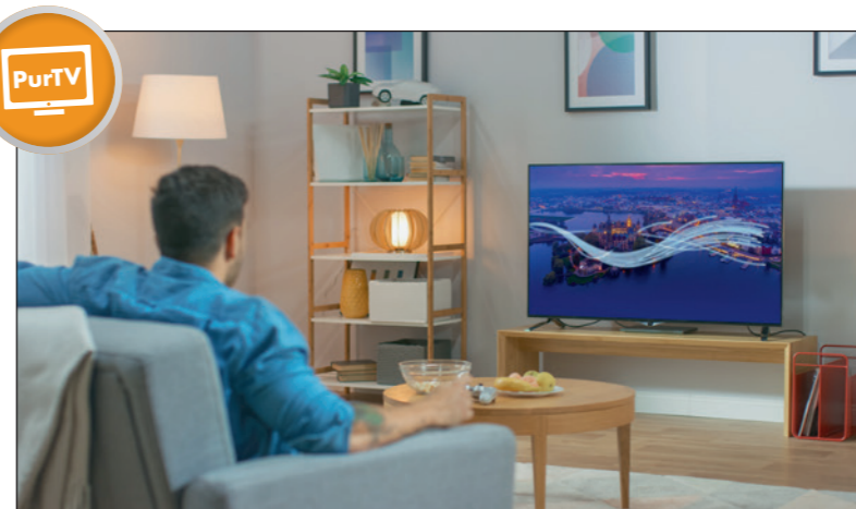
IP-TV über Glasfaser garantiert ruckelfreies Fernsehen und kann über einen bestehenden Glasfaseranschluss empfangen werden.

Beispielsweise werden beim Fernsehen die Lichtwellen per Glasfaser eingespeist und über ein sogenanntes Koaxialkabel in das TV-Signal umgewandelt. Da diese technische Variante allerdings nicht immer genutzt werden kann, bieten die Stadtwerke Schwerin ab Juli IP-TV an. Digitales Fernsehen via Internet kann auf einem Fernsehgerät, Tablet oder Handy geschaut werden. Das neue Produkt city.kom PurTV richtet sich auch an Kunden, die in einem Mehrfamilienhaus mit einer TV-Grundversorgung leben. Zugang zum PurTV erhält der Kunde ganz einfach per App auf dem Smart TV oder mittels mobilem TV-Stick. Die kleinste Option namens „Start HD“ kann mit einem Endgerät für monatlich nur zehn Euro genutzt werden. Mit der „Basis HD“ zu 13 Euro im Monat werden vier Endgeräte frei geschaltet, wobei parallel auf zwei Geräten geschaut werden kann. Volle Flexibilität bietet das „Premium HD-Paket“ für nur