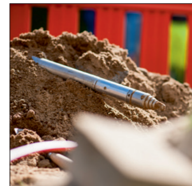
Per Erdrakete werden die Leerrohre unter die Erde gebracht