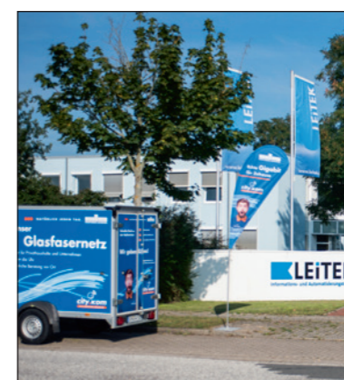
Seit August ist die LEITEK GmbH an das ultraschnelle Stadtwerke-Glasfasernetz angeschlossen

Hierbei informierten die Stadtwerke zur Verfügbarkeit des city.kom-Glasfasernetzes und über die Vorteile eines Business-Produktes. Das Treffen diente dem Erfahrungsaustausch zwischen ansässigen Unternehmen. Gleichzeitig erhielten alle Gäste eine umfangreiche Beratung durch das Stadtwerke-Glasfaserteam. Bernd Nottebaum, stellvertretender Oberbürgermeister der Landeshauptstadt, eröffnete dankend das Glasfaser-Frühstück: „Es freut mich sehr, dass sich die Stadtwerke Schwerin unentwegt für einen ausbalancierten Ausbau für Gewerbetreibende sowie für Privatkunden im Stadtgebiet engagieren. Immer mehr Unternehmen wird die Möglichkeit zur Nutzung von schnellem Internet und somit auch eine notwendige Wettbewerbsfähigkeit geboten. Wir sind dankbar, dass wir die Stadtwerke als Partner haben.“ Auch Hartmut Behncke, Geschäftsführer der LEITEK Informations- und Automatisierungstechnik GmbH, begrüßte die Gäste auf seinem Firmengelände persönlich und berichtete von einer „erfolgreichen Umstellung unseres Internets und Telefonanschlusses von der Telekom zu den Stadtwerken Schwe-