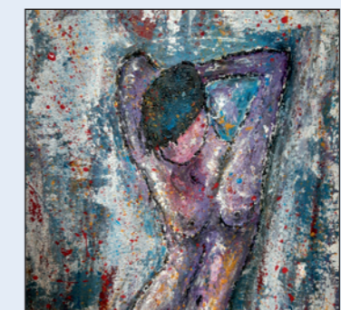
Leuchtendes Aquarell trifft Acryl

Schaufenstern des Stadtwerke-Kundencenters ausgestellt. Am Samstag, 30. Oktober von 17 bis 22 Uhr , verwandelt sich das Kundencenter in der Mecklenburgstraße 1 nun in ein offenes Atelier. Besucher können der Künstlerin beim kreativen Arbeiten über die Schulter schauen, eine Auswahl ihrer Werke bestaunen und miteinander ins Gespräch kommen.